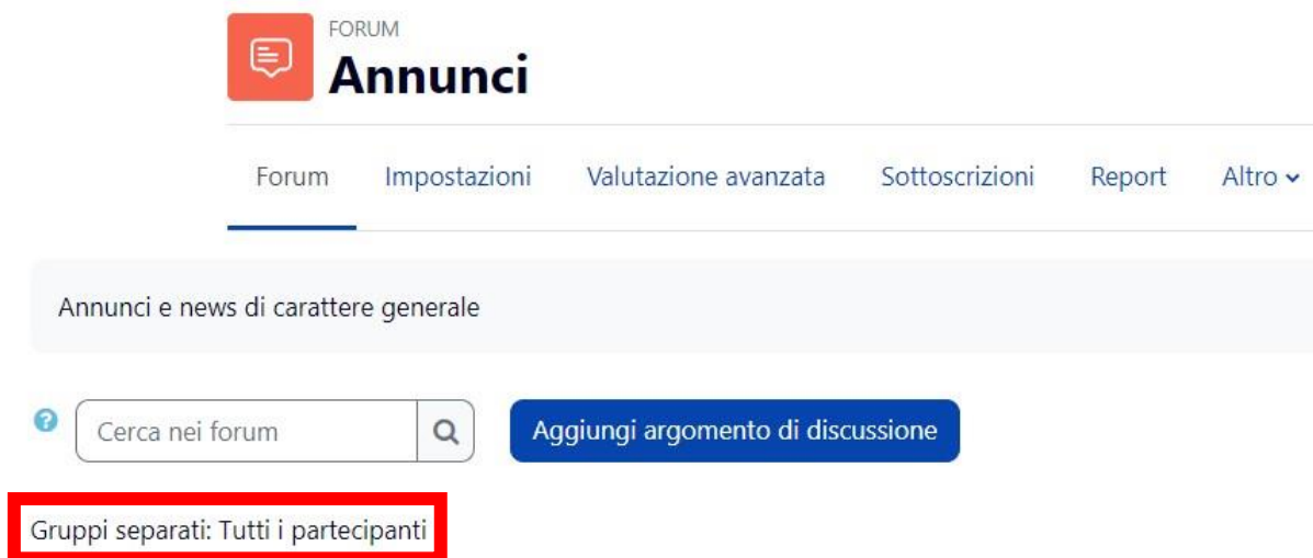
Figura 4 - Un forum Annunci in modalità Gruppi separati

La modalità gruppo assegnata sarà visualizzata nelle impostazioni della singola attività (Figura 4) ad esempio: